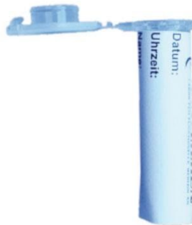
Afb. speekselbuisje met etiket