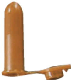
Speeksel 7: bruin