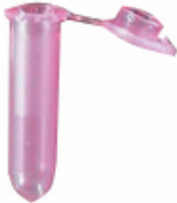
Speeksel 5: rose