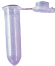
Speeksel 6: paars