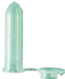
Speeksel 4: mintgroen