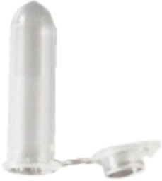
Speeksel 1 : wit lichtgroen