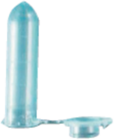
Speeksel 3: blauw